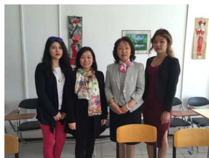
孙慧教授访问西安外国语大学阿斯塔纳孔子学院