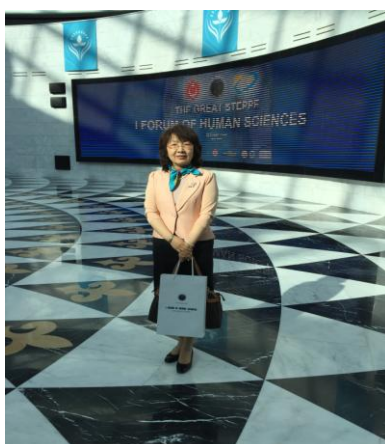
“人文科学大会”在哈萨克斯坦总统图书馆召开

5月23日，“人文科学大会”在哈萨克斯坦第一总统图书馆举行，来自14个国家的专家学者参加了本次大会。大会采用英语、土耳其语、俄语和哈萨克语四种语言主要分析和讨论了突厥世界研究问题、确定研究的基本方向、加强与世界知名专家科学的关系、制定解决全球和区域层面的紧迫问题的建议。会议涉及的领域包括：历史学、考古学和人种学、经济学、文学艺术、语言学等领域。